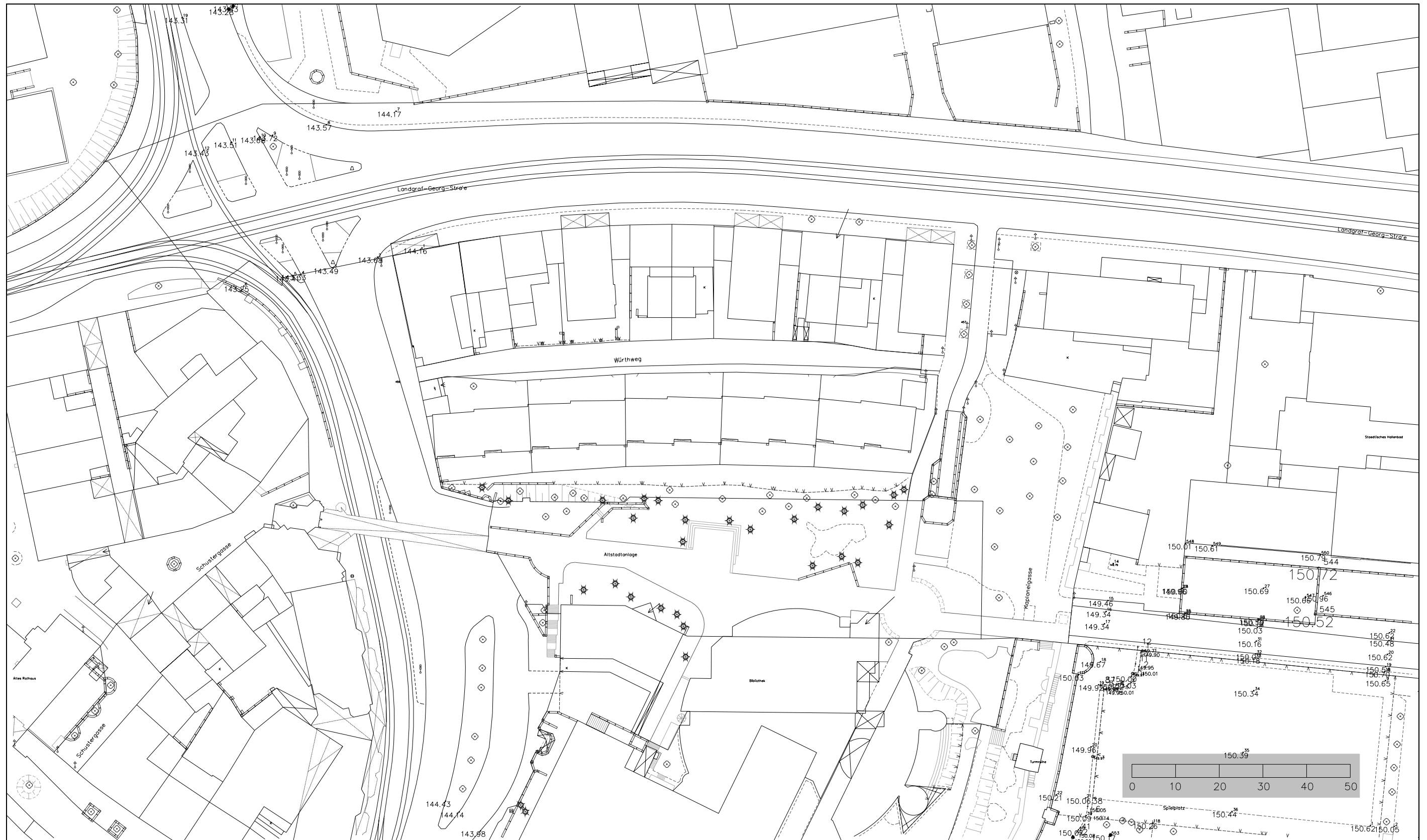
Lageplan 3 – Holzstraße, Landgraf-Georg-Straße