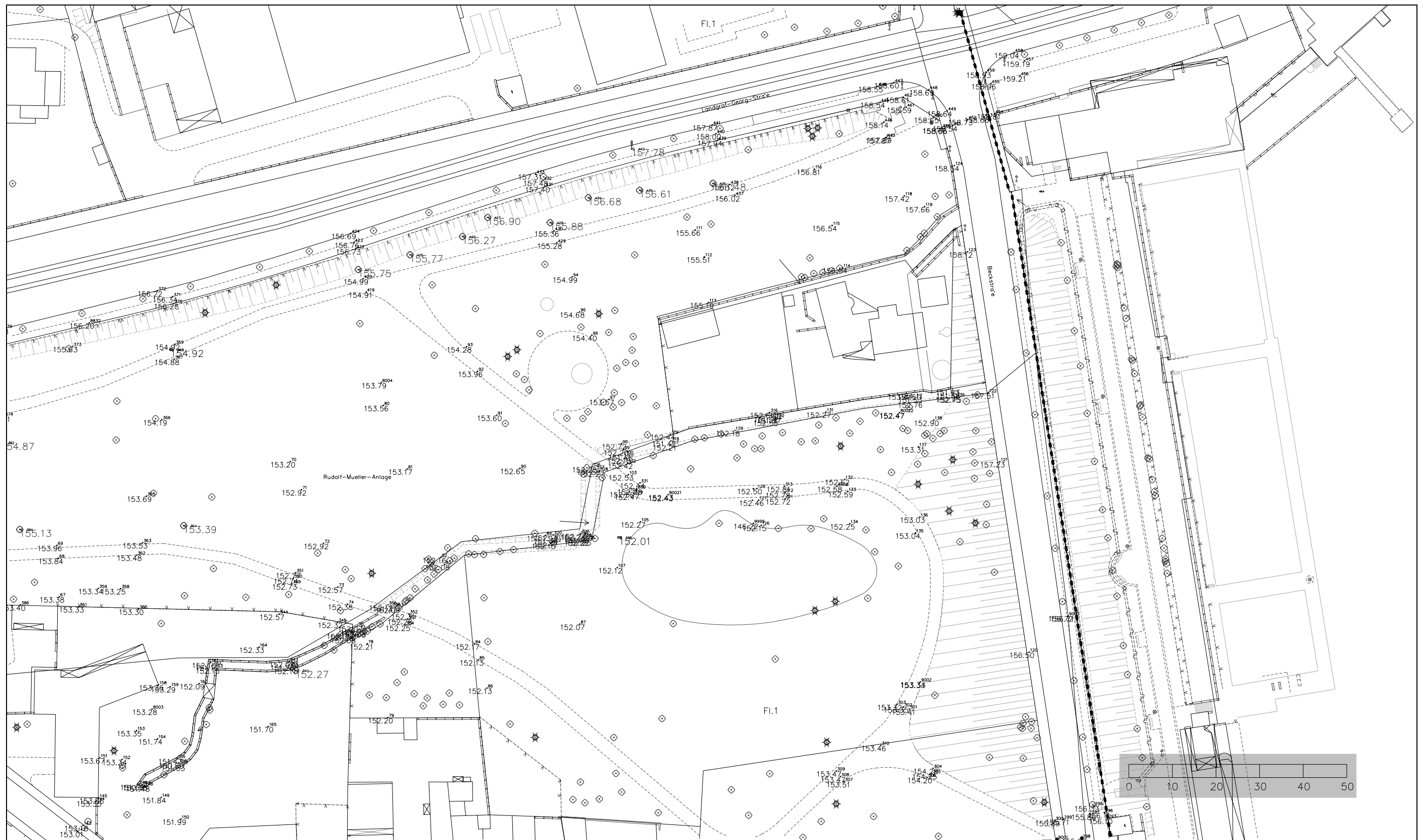
Lageplan 1 – Großer Woog und Rudolf-Müller-Anlage