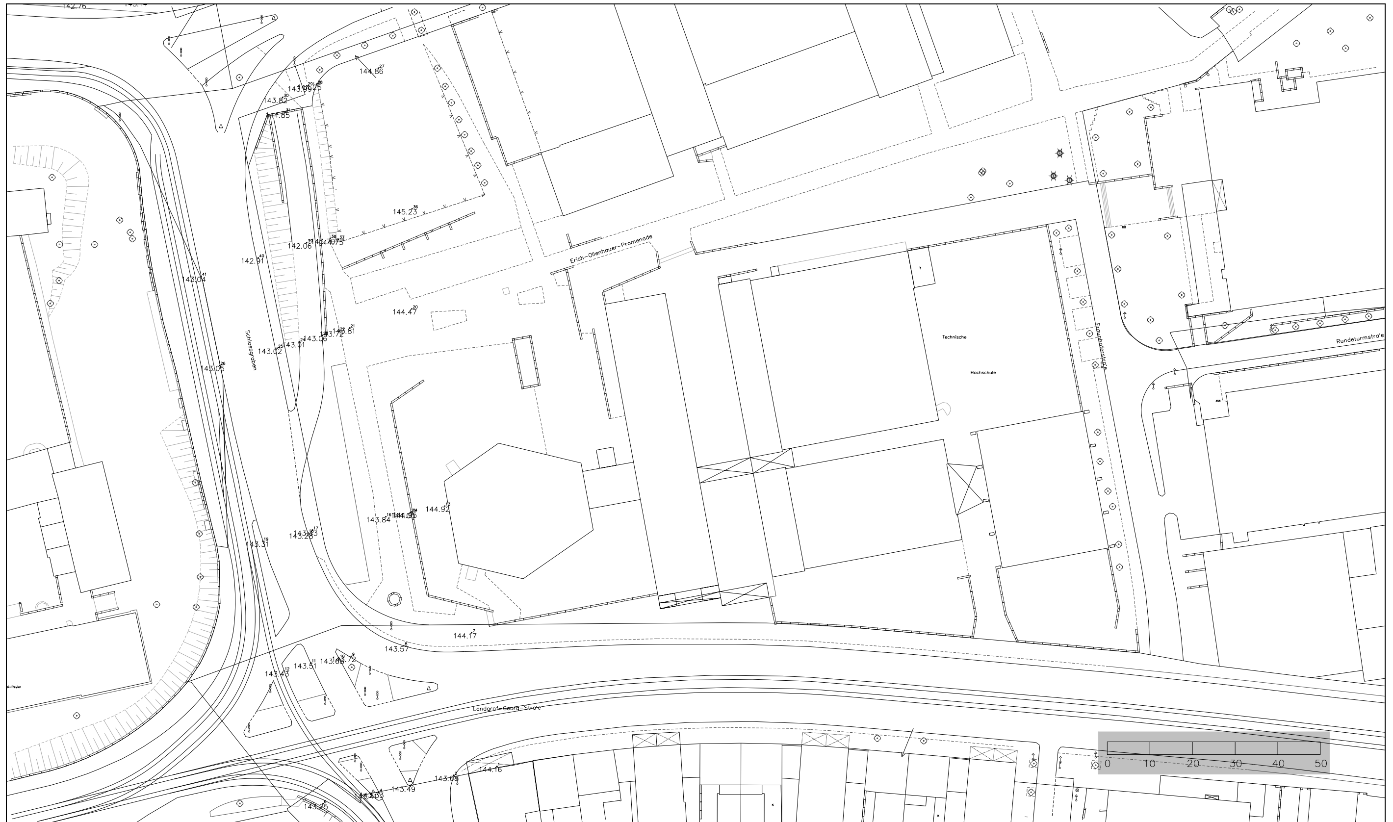
Lageplan 4 – Schlossgraben, Landgraf-Georg-Straße